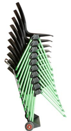
Coda i stabel på Nordic stoltralle