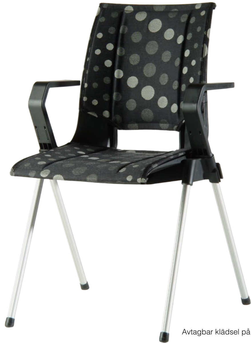
Avtagbar klädsel på sits och rygg