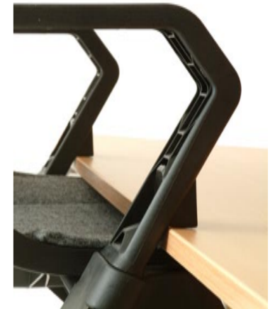
Med armstöd har Coda upphängningsfunktion för bord