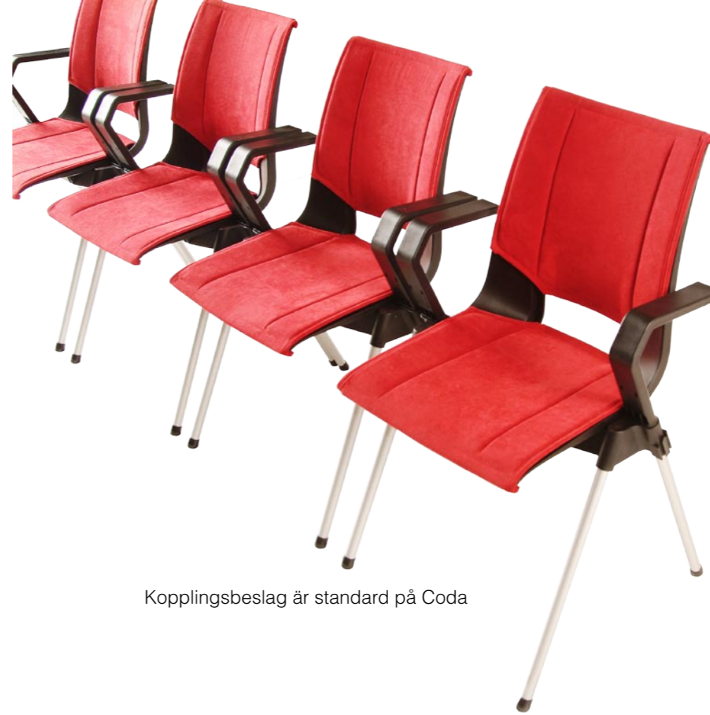
Kopplingsbeslag är standard på Coda